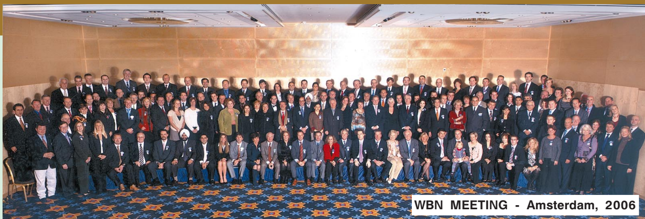
WBN MEETING - Amsterdam, 2006

емът на нови брокери е на база критерий за професионализъм в посредническата дейност, както и на доказани възможности за професионално обслужване на големи корпоративни клиенти, но и на по-малки фирми. ЗБК „Балканъ“ беше единственият български брокер, поканен за презентация пред Изпълнителния комитет на WBN и пред срещата на собствениците на брокерските фирми, коя-