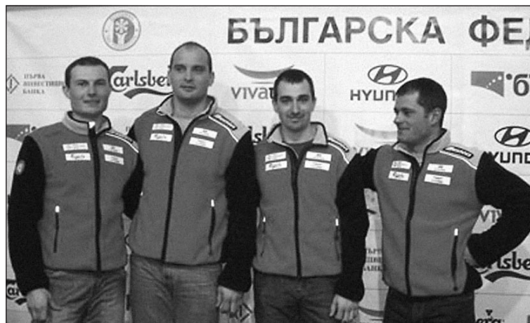
Темата разработи ИЛЕАНА СТОЯНОВА

В ДЗИ АД са сключвани застраховки и от осемте групи