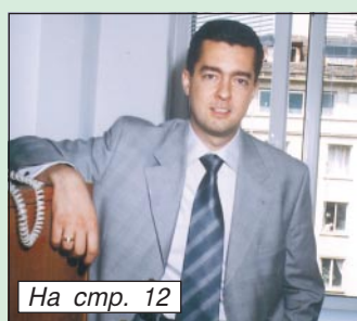
На стр. 12