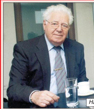
На стр. 9, 10, 18