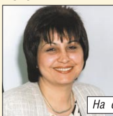
На стр. 8, 15, 17