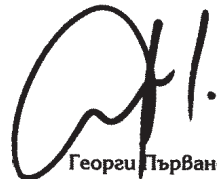
Георги Първанов ПРЕЗИДЕНТ НА РЕПУБЛИКА БЪЛГАРИЯ