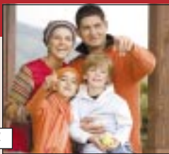
На стр. 4