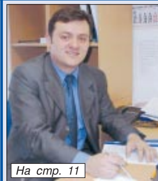
На стр. 11

ЩАСТЛИВ СЪМ, ЧЕ РАБОТЯ ТОЧНО В „ЕВРОЛАЙФ“