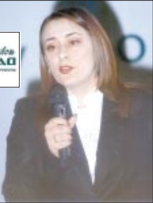
На стр. 13