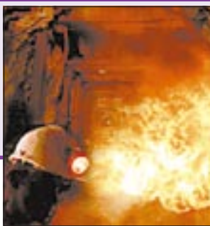
На стр. 7, 10