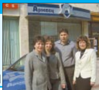
На стр. 12

Добре дошли в www.zastrahovatel.com Вашият компас в застраховането!