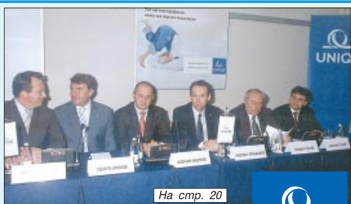
На стр. 20