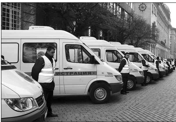
17 специализирани автомобили за контрол, закупени по програма ФАР, вече циркулират по нашите пътища

новище относно законопроекта, което е изпратено до председателя на парламента Георги Пирински с