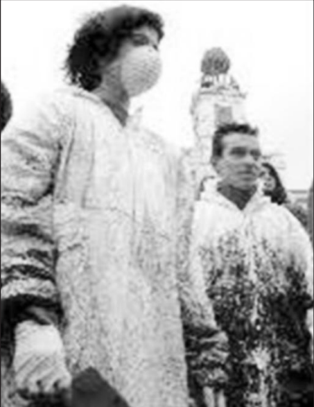
Демонстранти в Мадрид по повод голям петролен разлив