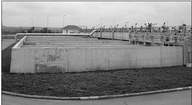
Новата пречиствателна станция за отпадни води в Горна Оряховица