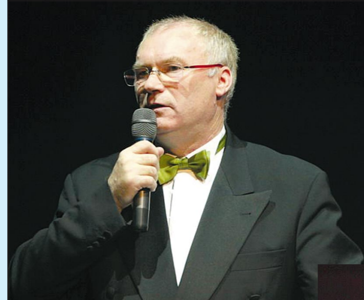
рес. И продължи:

ГОРДЕЕМ СЕ С ВАС Както всяка година, и тази вечер сме се събрали заедно с нашите най-успешни ръководители и консултанти, с нашите партньори и най-вече с тези, които са главните виновници за нашите успехи, за да завършим заедно годината и да отбележим успехите си с този голям празник.