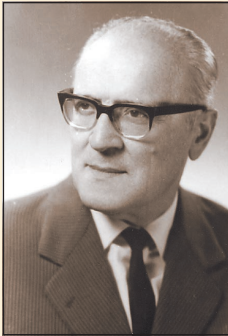
Проф. Иван Стефанов

Така се създава първият у нас държавен застрахователен институт, който през 2002 г. беше приватизиран, но запази името си ДЗИ и продължи да държи лидерска позиция на днешния частен застрахователен пазар.