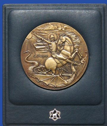
СЛАВИМИР ГЕНЧЕВ