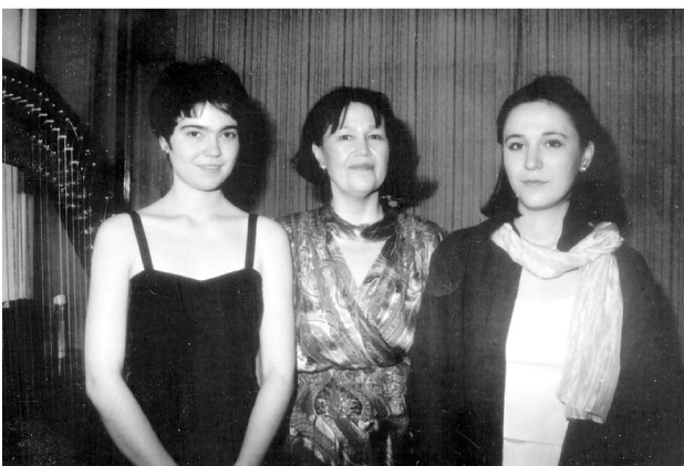
Жени Захариева с двете си дъщери