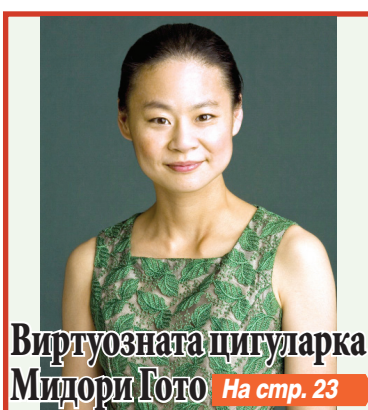
Виртуозната цигуларка Мидори Гото