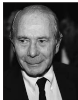
Морис „Ханк“ Грийнбърг

Акционерите на „Америкън интърнешънъл груп“ твърдят, че бившият главен изпълнителен директор на застрахователния гигант Морис „Ханк“ Грийнбърг и други фирмени мениджъри им дължат 1 млрд. щ. долара, които били отклонени към контролираната от Грийнбърг компания C. V. Starr & Co. И смятат да го докажат по време на съдебния процес, който започва на 15 септември т. г. в Уилмингтън, щата Делавейър. Ръководителите на пенсионния фонд на учителите от щата Луизиана са написали в съдебния иск, че цели пет години бившите изпълнителни директори на „Ей Ай Джи“ са надплатили за услуги на C. V. Starr & Co., където също са били на щат. Фирмата им е плащала премии въз основа на получените от „Ей Ай Джи“ комисионни. Застрахователната групировка понесе загуба в размер на 13.2 млрд. щ. долара през първото полугодие на 2008 г. и неотдавна бе принудена да отпише други 11 млрд. долара от преценка на вложения, което може да наложи привличането на допълнителен капитал. И нищо чудно да го получат точно от бившите си ръководители.